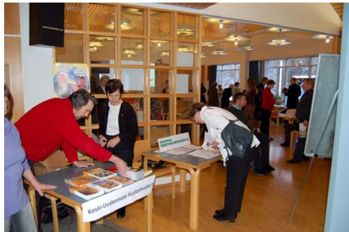
Keski-Uudenmaan ensimmäinen yhteisöllisyyspäivä

Keski-Uudenmaan yhteisöllisyyspäivää vietettiin ensimmäistä kertaa talvella 2009. Päivän tarkoituksena oli edistää eri toimijoiden verkostoitumista sekä saada tietoa mm. vapaaehtoistyöstä, yhteisöllisyydestä ja sosiaali- ja terveysjärjestöistä. Annetussa palautteessa erityisen positiivisena pidettiin sitä, että oli mahdollisuus tutustua toisiin järjestöihin ja että yhdessä tekeminen kannattaa. Päivän aikana olisi saanut olla enemmän kävijöitä, minkä lisäksi toivottiin muidenkin järjestöjen voivan osallistua sosiaali- ja terveyspuolen ohella. Kokonaisuutena tapahtuma oli kuitenkin tärkeä yhteistyön areena. Yhteisöllisyyspäivä tullaan toteuttamaan vuosittain ympäri KUUMA-seutua. Tulevina vuosina tilaisuus on tarkoitus rakentaa niin, että se houkuttelee paremmin paikalle kuntalaisia ja kuntien edustajia.