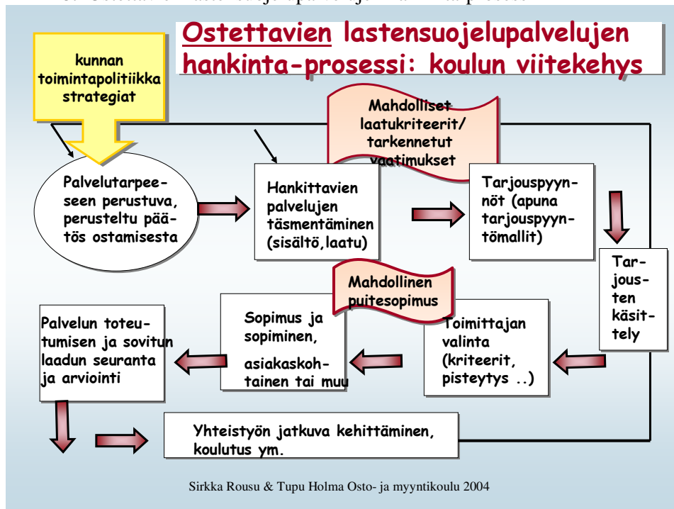
LIITE 3. Ostettavien lastensuojelupalvelujen hankinta-prosessi

Tarjouspyyntöjen perusteella laaditaan tarjousyhteenveto, jossa pisteytetään tarjouksen tehneet palvelun tuottajat etukäteen asetettujen kriteerien mukaisesti. Tämän jälkeen allekirjoitetaan mahdollinen puitesopimus niiden palvelun tuottajien kanssa, joiden on arvioitu vastaavan asetettuihin tarpeisiin. Palvelun toteutumisen ja sovitun laadun seuranta kuuluvat myös olennaisena osana lastensuojelupalvelujen hankintaprosessiin